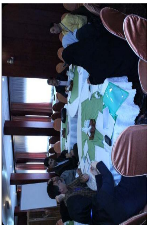
بحث های گروهی