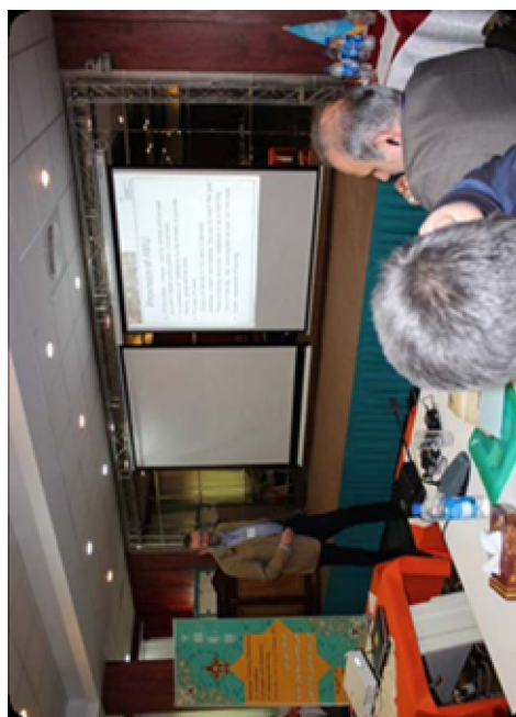
سخنرانی تخصصی بورن اسکاوسگارد (دانمارک)