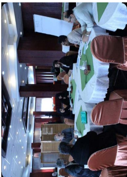
بحث های گروهی