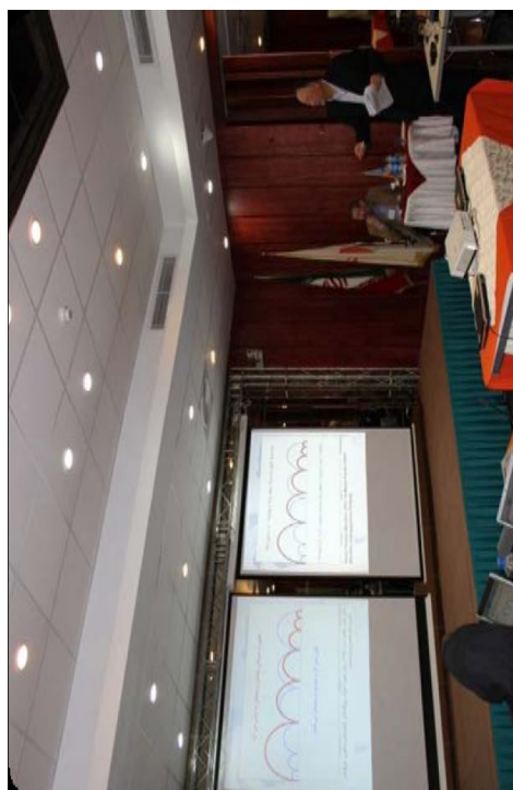
سخنرانی تخصصی جین یانگ (موسسه یادگیری مادام/العمر بونسکو)