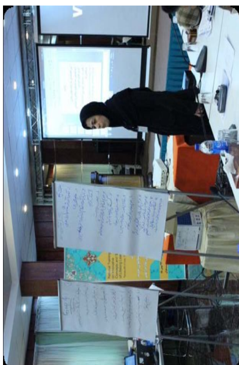
ارائه بحث گروهی